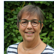
Administratrice déléguée aux partenariats et aux événements #66993