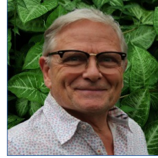
Past président #57401