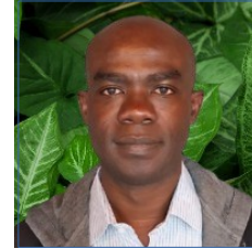
Administrateur délégué à la formation #75102