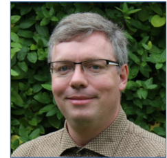
Administrateur délégué aux réseaux et aux échanges #76345